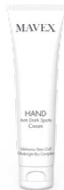
ANTI DARK SPOTS CREAM 100 ml

Nutriente ed emolliente, lenisce e leviga immediatamente anche le pelli più secche grazie al forte potere esfoliante dei Cristalli di Sale. Ridona alle mani tutto il loro splendore con un sorprendente effetto vellutante. Le mani ritrovano tutta la loro purezza, la pelle risulta ossigenata e straordinariamente morbida. Un vero rituale di purificazione che dona una profonda sensazione di benessere.