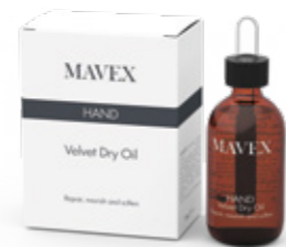
VELVET DRY OIL 50 ml

Siero intensivo concentrato per la bellezza delle mani che agisce in maniera selettiva e con grande efficacia negli strati più profondi dell'epidermide, riducendo significativamente le discromie e le macchie cutanee. Contrasta i radicali liberi e previene l'invecchiamento della pelle grazie all'azione combinata delle Cellule Staminali di Stella Alpina, Té Verde, Crescione Svizzero, Genisteina, Acido Mandelico e Acido Ialuronico, donando alle mani un aspetto più giovane.