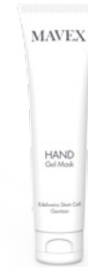
GEL MASK 100 ml

Una miscela di oli vegetali ricchissimi di vitamine che proteggono la pelle e favoriscono efficacemente elasticità, idratazione e morbidezza. Velvet Dry Oil possiede spiccate proprietà emollienti e seboesostitutive, in grado di stimolare i processi riparativi di derma ed epidermide. Si assorbe facilmente, non unge, dona un'immediata sensazione di relax. La pelle nutrita dalle vitamine riacquista una straordinaria luminosità e morbidezza.