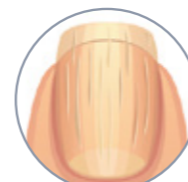
STRIATE E ISPESSITE