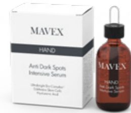
ANTI DARK SPOTS INTENSIVE SERUM 50 ml

Trattamento di bellezza quotidiano per le mani che racchiude tutta la forza e l'efficacia degli ingredienti naturali delle Alpi. Gli estratti di Mirtillo, Genziana, Rusco e Abete Rosso svolgono una potente azione antiossidante e protettiva, mentre Ultrabright Bio Complex®, Papaina e Cellule Staminali di Stella Alpina agiscono in sinergia sulle macchie, le discromie, la secchezza e la rigenerazione della pelle, che apparirà subito più luminosa, tonificata e idratata in profondità.