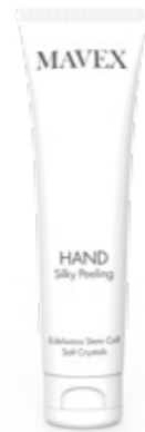
SILKY PEELING 100 ml

Nutriente ed emolliente, lenisce e leviga immediatamente anche le pelli più secche grazie al forte potere esfoliante dei Cristalli di Sale. Ridona alle mani tutto il loro splendore con un sorprendente effetto vellutante. Le mani ritrovano tutta la loro purezza, la pelle risulta ossigenata e straordinariamente morbida. Un vero rituale di purificazione che dona una profonda sensazione di benessere.